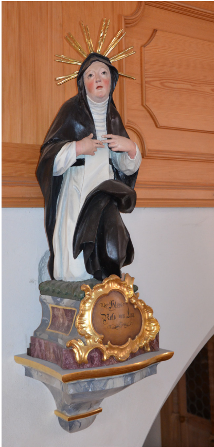
Hl. Rosa von Lima