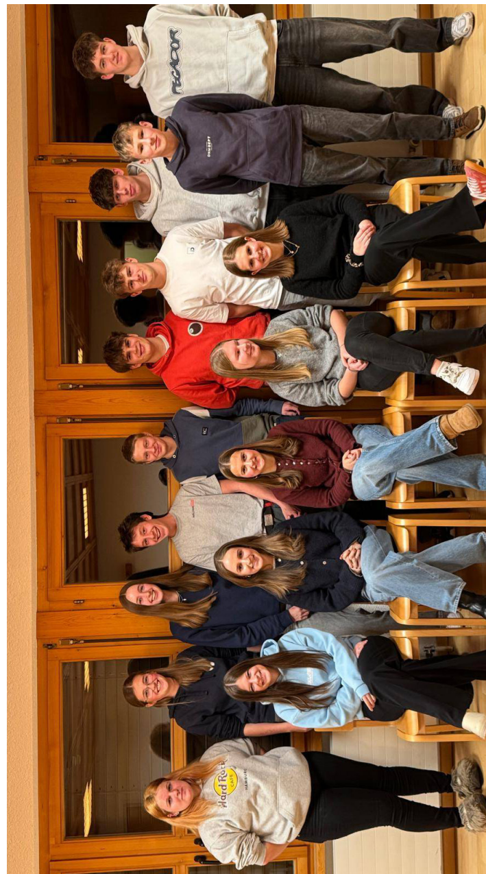
(Auf dem Bild der Firmlinge fehlen 3 Personen)