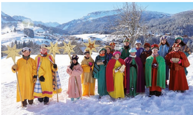
Die Riezler Starnsinger