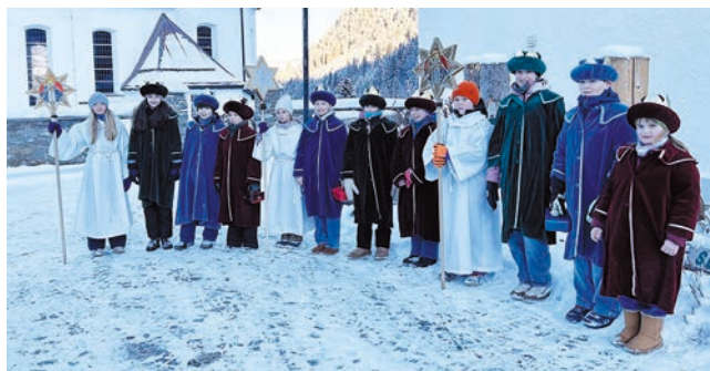
Oberes Bild: die Sternsinger in Mittelberg; unteres Bild: die Sternsinger in Hirshegg.